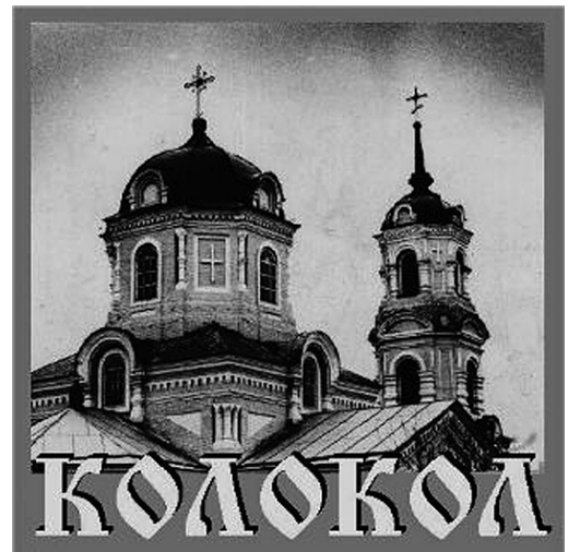
● 4 ДЕКАБРЯ – ВВЕДЕНИЕ ВО ХРАМ ПРЕСВЯТОЙ ВЛАДИЧИЦЫ НАШЕЙ БОГОРОДИЦЫ И ПРИСНОДЕВЫ МАРИИ

Оксана ПРИДВОРЕВА («Белгородские известия» № 091 от 18 ноября 2025 г.).