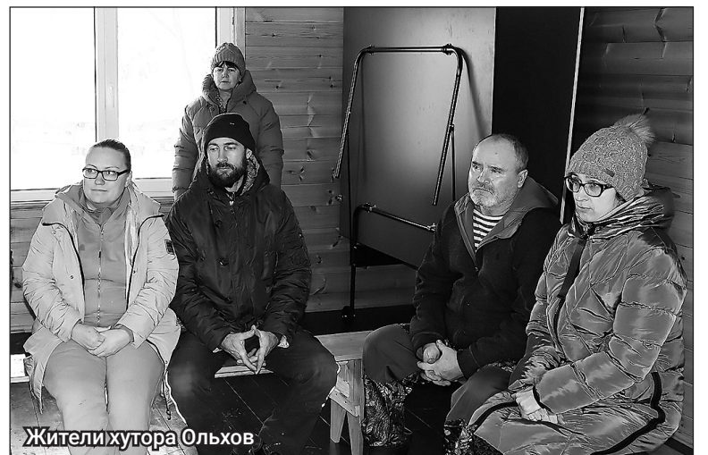
Жители хутора Ольхов

седки у берега реки Оскол, а также на территории зоны отдыха «Лучики». В рамках губернаторской программы по расчистке водных объектов «Наши реки» в прошлом году