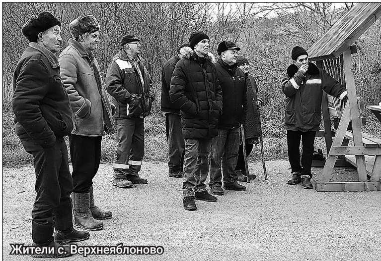
Жители с. Верхнеяблоново

В прошлом году в селе Старосельцево было произведено грейдирование дорог, ведущих к роднику и живописному месту отдыха на горе Меловатка. Установлены 4 бе-