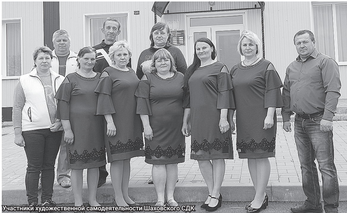
Участники художественной самодеятельности Шаховского СДК