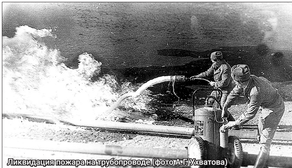
Ликвидация пожара на трубопроводе