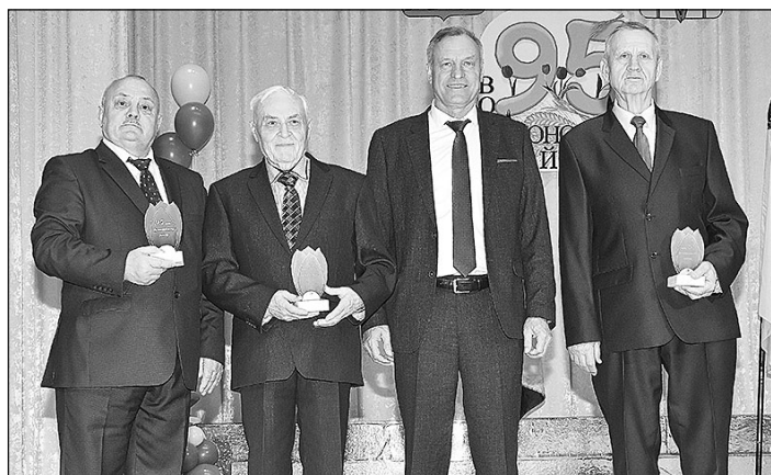
Этот год будет знаменательным для каждого волоконовца, ведь в конце августа наш район отметит 95-ю годовщину со дня своего образования.

Сколько ратных и трудовых подвигов совершено волоконовцами за эти годы! Наш район взрастил не одно поколение талантливых людей, которые достигают высоких результатов в производственной деятельности и социальной сфере, одерживают победу в региональных и всероссийских олимпиадах, творческих конкурсах и спортивных соревнованиях. А сколько прекрасных и интересных событий связано с нашим краем! Наша история – это история прославленных тружеников, единство традиций и современности, неразрывная связь поколений и созидательный совместный труд во благо процветания родного края.