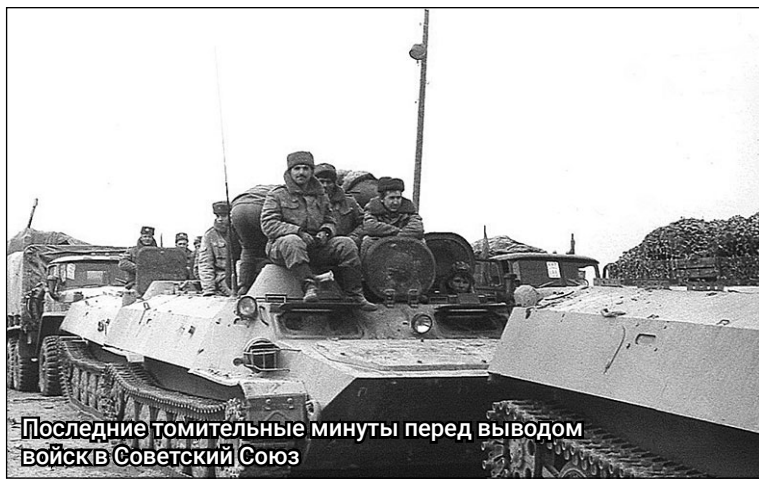
Последние томительные минуты перед выводом войск в Советский Союз

Материал к публикации подготовила Анна ШЕВЧЕНКО