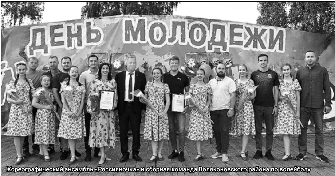
Хореографический ансамбль «Россияночка» и сборная команда Волоконовского района по волейболу