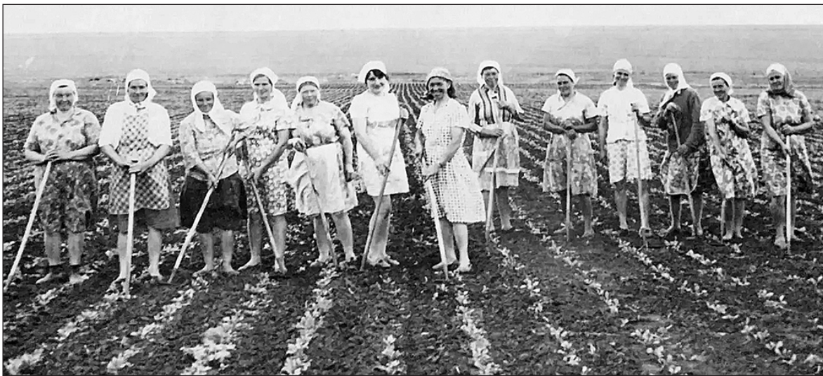
Бригада свекловичниц села.