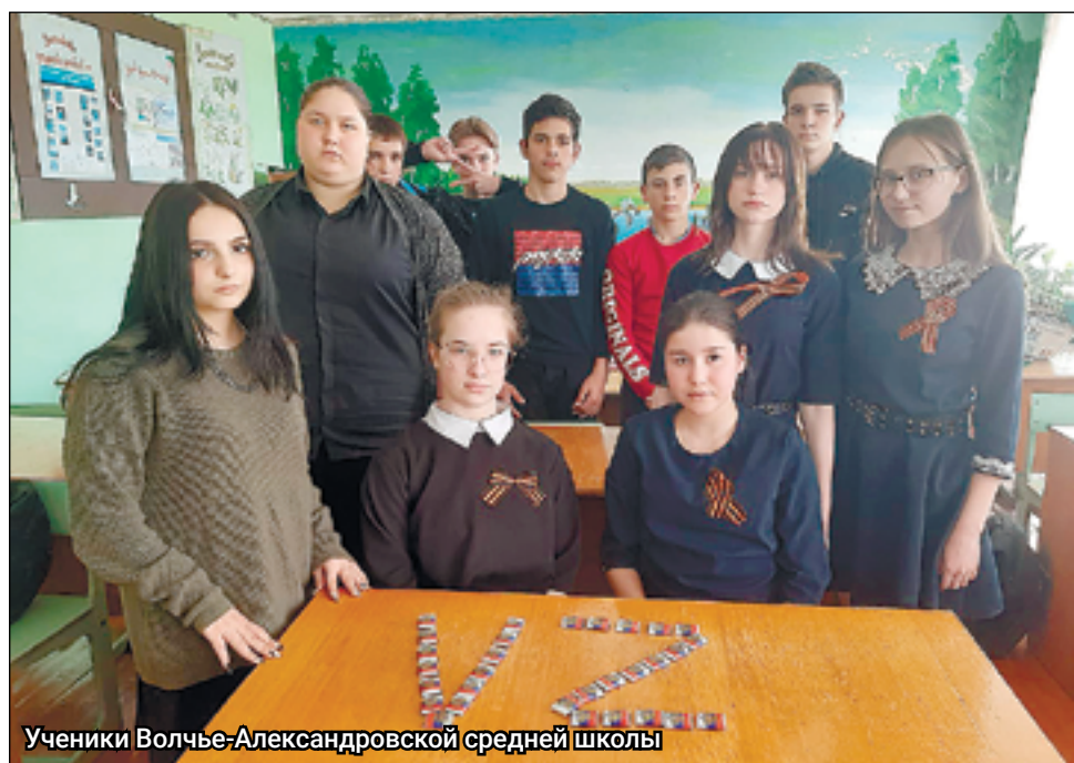
Ученики Волчке-Александровской средней школы

Уже более двух месяцев российские военные выполняют задачи по демилитаризации и денацификации Украины. Решение, принятое Верховным главнокомандующим, граждане России не просто поддержали, но и, объединившись, стали опорой друг для друга. С первых дней специальной военной операции наши сограждане показали, что русский народ един во всём, всегда и везде.