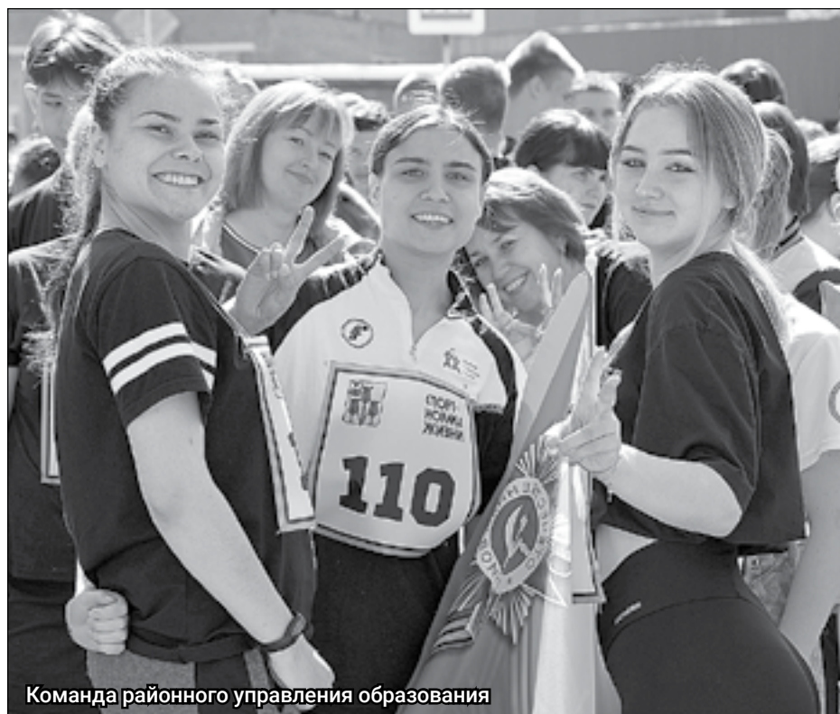
Команда районного управления образования

В этот же день прошла ещё одна спортивная акция. Состоялась товарищеская игра по волейболу между сборными военнослужащих РФ и администрации района. Победила, конечно же, дружба. Время пролетело незаметно, а все участники получили массу положительных эмоций.