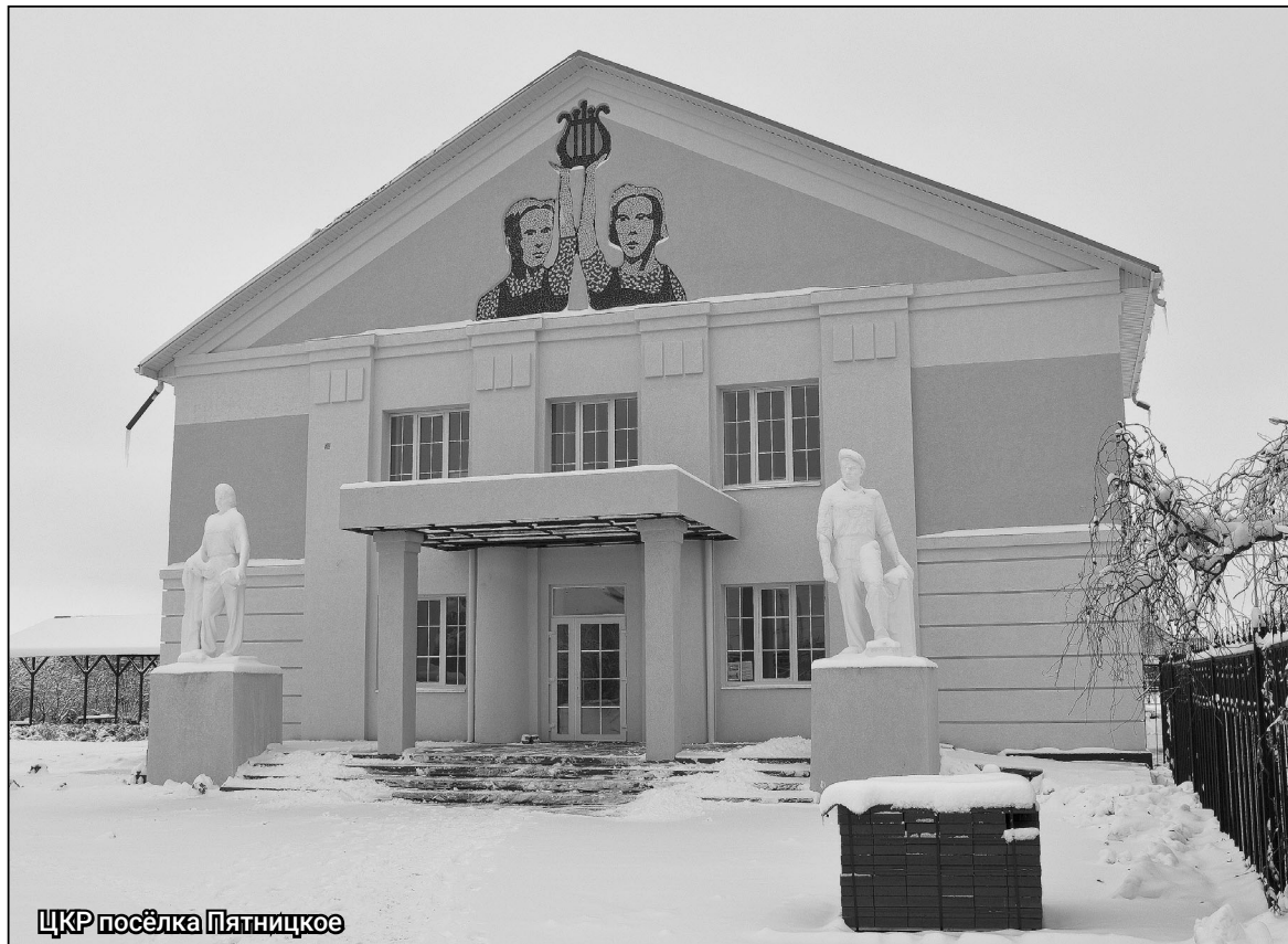
ЦКР посёлка Пятницкое