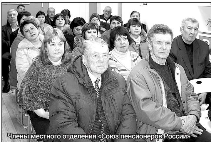
Члены местного отделения «Союз пенсионеров России»

В поселке Волоконовка состоялась отчетно-выборная конференция местного отделения «Союза пенсионеров России».