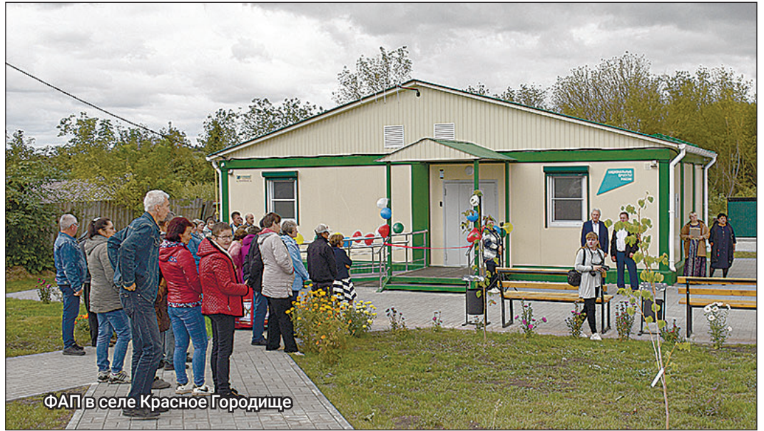
ФАП в селе Красное Городище