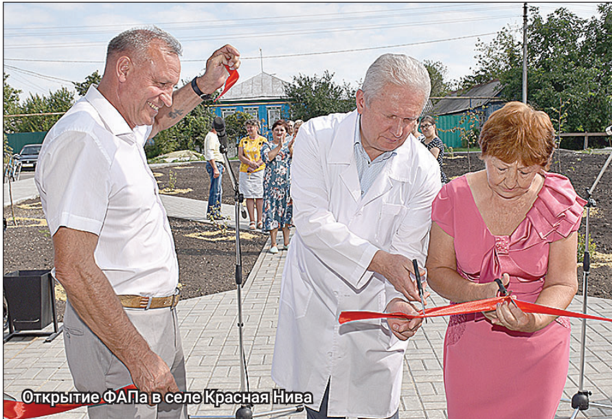
Открытие ФАПа в селе Красная Нива