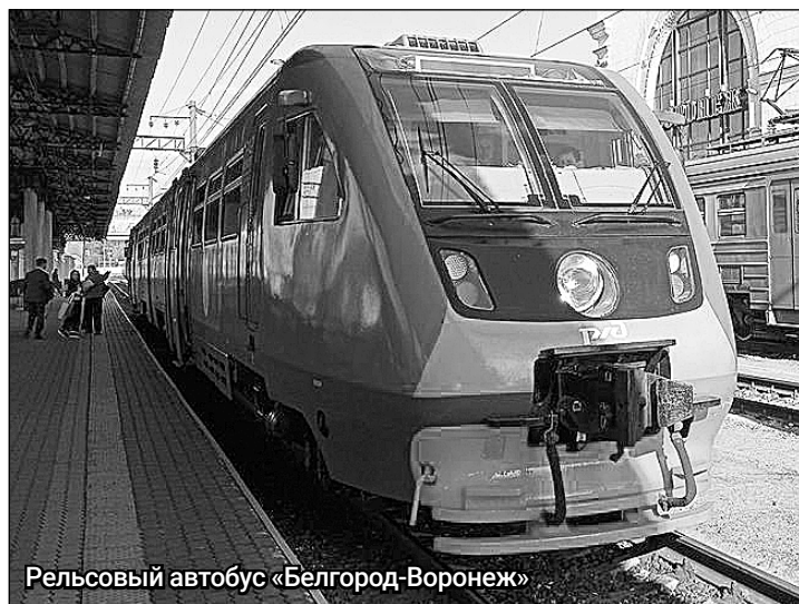
Рельсовый автобус «Белгород-Воронеж»

13 января отмечается День российской печати, он связан с исторической датой – началом издания первой российской печатной газеты. 13 января 1703 года по указу Петра I вышел в свет первый номер русскоязычной газеты «Ведомости».