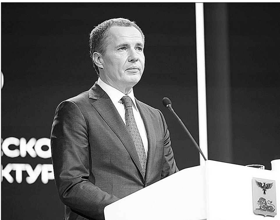
Губернатор Белгородской области В.В. Гладков отчитался о работе правительства региона перед депутатами областной Думы.